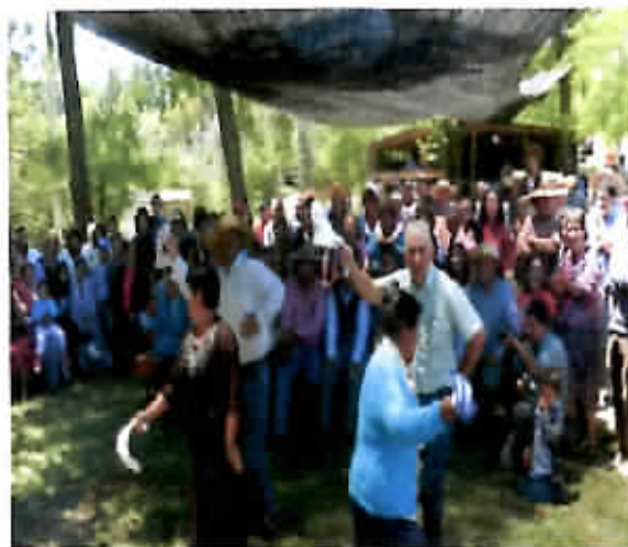
Encuentro Cantotres Populares y Cultores de la Cueva Campecina.