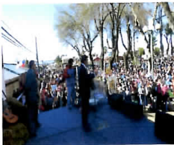
Acto Cívico 16 de Julio