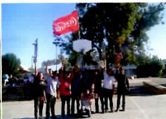
Primer Encuentro de Skaters