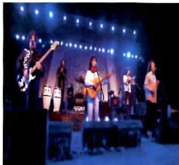
Festival El Cantar del Digullín.