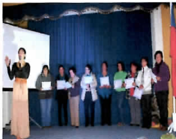
Exhibición de tejidos en lana de artesanas Locales