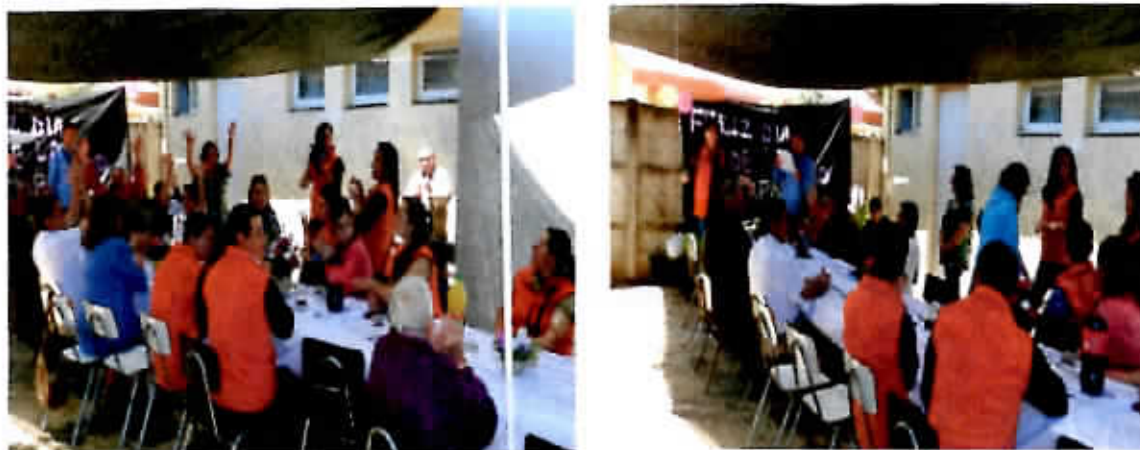
Celebración Día de la Discapacidad.