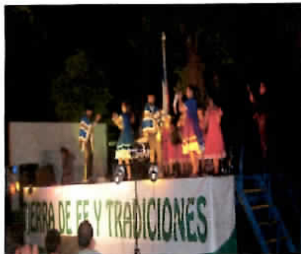
Noche del Folclore