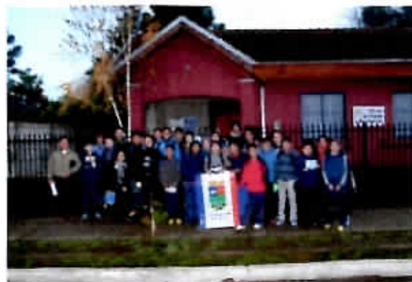
Delegación Comida IND, Chillán