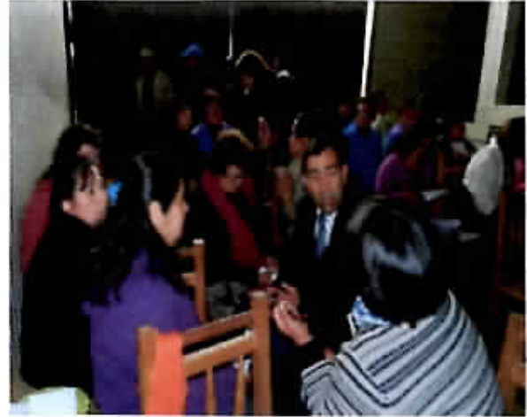
Municipio en Terreno, sector Chamizal.