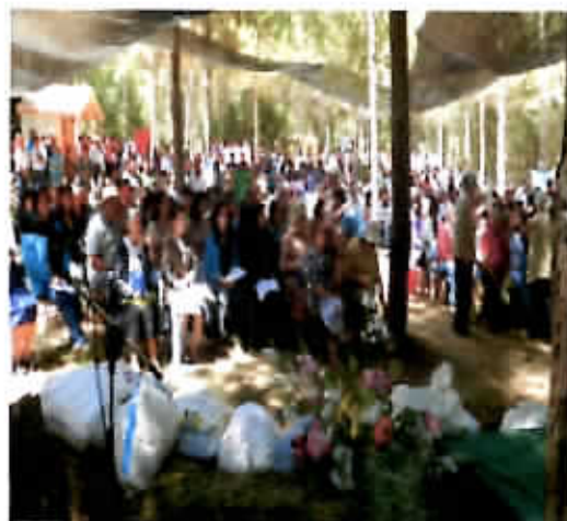
Misa de la Espiga