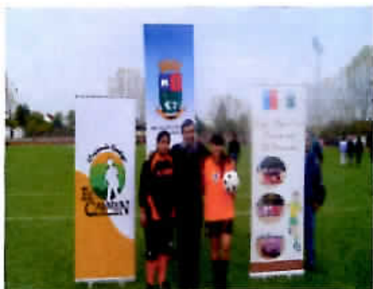
Torneo de Fútbol Femenino