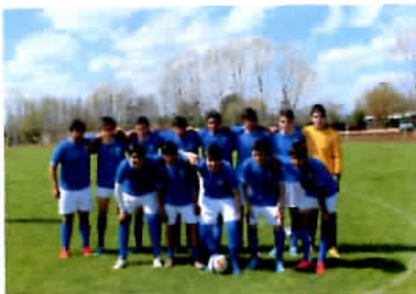
Escuela de Fútbol Municipal