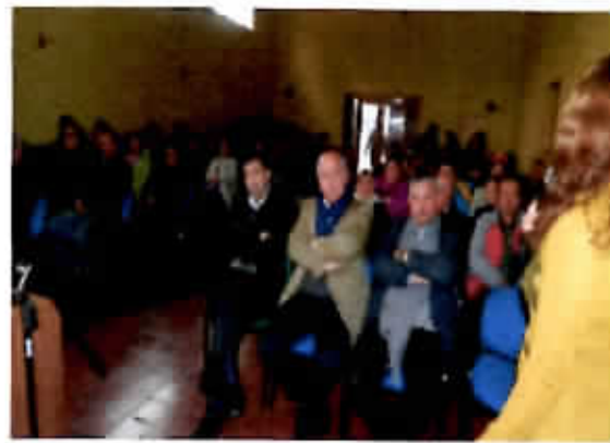
Programa de invierno 1 y 2.