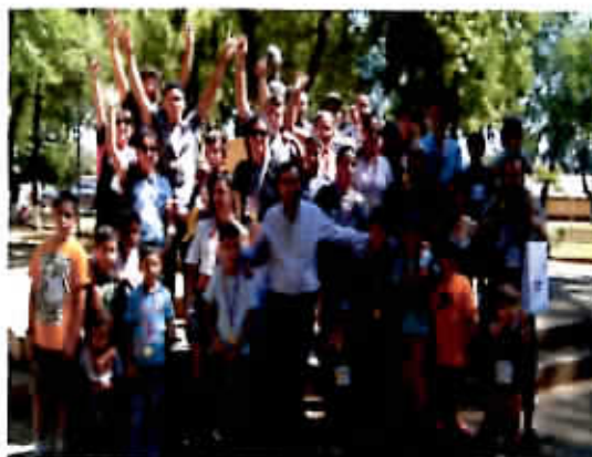
Corrida Familiar Día del Pueblo