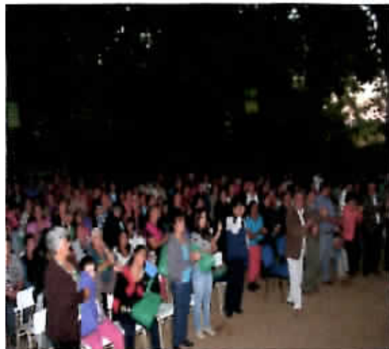
Conmemoración Día Internacional de la Mujer