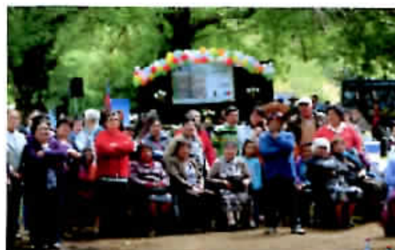
Celebración Día del adulto mayor