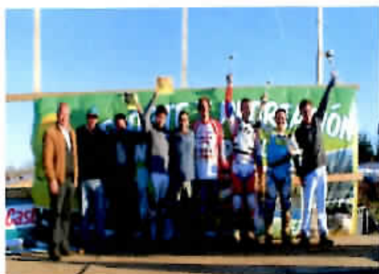
Competencia Enducross Día del Pueblo